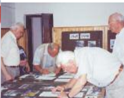
u góry: Przygotowywanie tablic na wystawę „75 lat harcerstwa we Włochach”