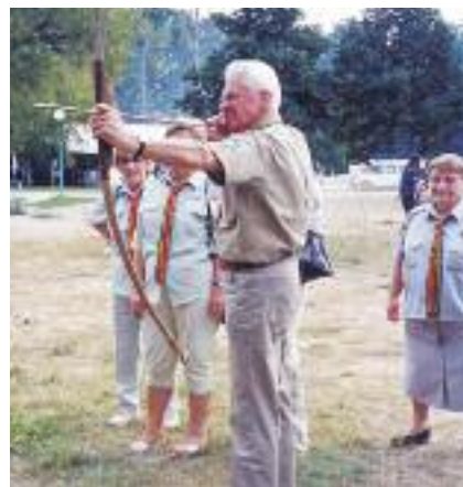
Na zlocie harcerskim w Spale

10 kwietnia br. odszedł na wieczną wartę. Pożegnaliśmy Go z wielkim żalem harcerską pieśnią na Cmentarzu Bródnowskim.