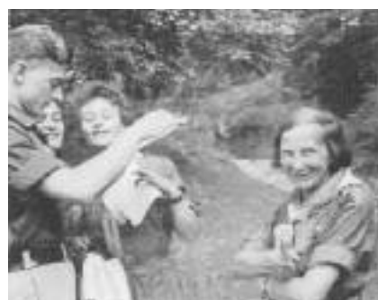
Instruktorzy na obozie w Jaworzu-Nałężu, 1958 r.