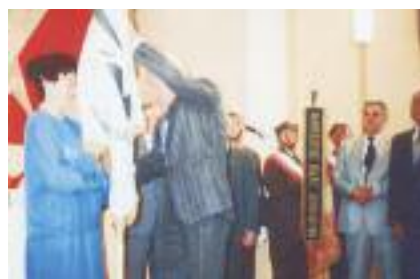
Wręczenie sztandaru Dyrektorce szkoły przy ul. Promienistej