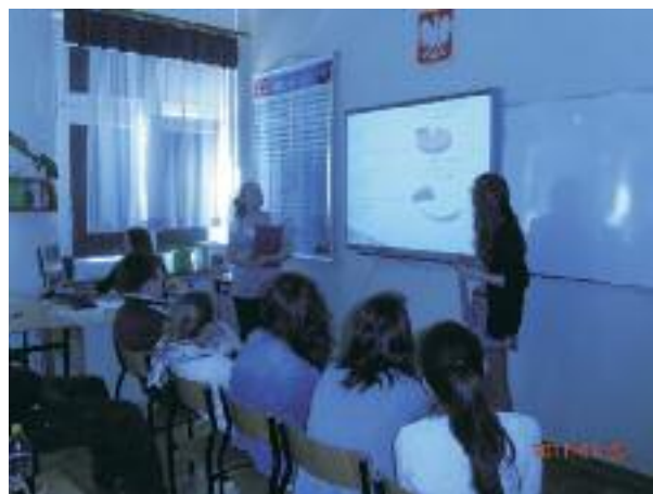
fol. arch. szkoły