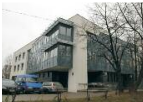
fol. UD Włochy

Relację z uroczystości zamieścimy w następnym numerze biuletynu. « red.