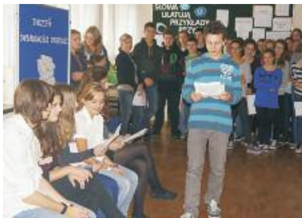
fol. arch. szkoły

Ponad 80% uczniów wzięło udział w przynajmniej jednym zajęciu. Wielu z nich zrozumiało, że nie mają powodu do wstydu czy poczucia niższości, lecz tak samo jak inni rówieśnicy mogą osiągać wyznaczone cele, wygrywać olimpiady i konkursy.