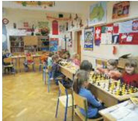
fol. arch. szkoły

Jesteśmy także w trakcie realizacji projektu edukacyjnego organizowanego przez WCiES pod honorowym patronatem Kuratorium Oświaty, a skierowanego szczególnie do uczniów ze specyficznymi